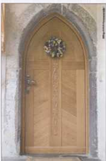
Die breite Palette individueller Anfertigungen: Von extravagant bis zu detailgetreuer Nachbildung