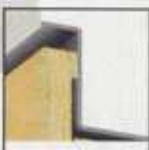
Detailstudie - robuste Putzkanten garantieren eine hohe Schutzfunktion, genaue und leichte Verarbeitung sowie gleich bleibend breite Schattenfugen