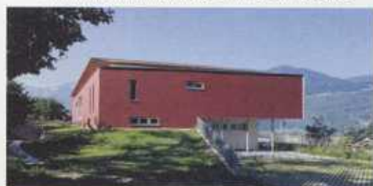
Die „F-Zarge®“ ist prädestiniert für die neue Schlichtheit im Niedrigenergie- und Passiv-Hausbau