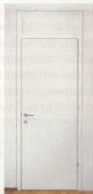
Moderne Architektur - die „F-Zarge®“ in raumhoher Ausführung

Die flexible Gestaltungsfreiheit von Rubner-Türen bei Design, Holzart, Verglasung und Beschlägen bleiben in Kombination mit der „F-Zarge®“ unbegrenzt erhalten.