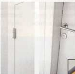
Zeitlose Eleganz - kombinier- bar mit sichtbaren oder verdeckt liegenden Türbändern