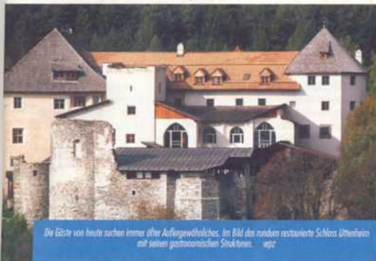
Die Gäste von heute suchen immer öfter Aufregendes. Im Bild das rundum restaurierte Schloss Uttenheim mit seinen gastronomischen Strukturen. wpt

Intelligence International" auf der ITB. Im Trend liegen demnach preiswertere und kürzere Reisen. Durch die Terror-Anschläge der letzten Jahre ist das Sicherheits-Bewusstsein der Reisenden gestiegen und die Lust an Fernreisen gesunken. Die neuen Konsumenten sind reifere, ältere, erfahrene Reisende, die nach „authentischen, naturorientierten und individuellen Reisen“ suchen. Das Internet spielt zunehmend eine wichtige Rolle für Reiseplanungen und Buchungen.