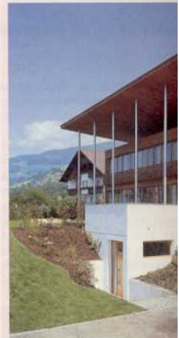
La ciasa cun le tēt che ne d "Holzbaupreis Südtirol".

La ciasa premiada "Honigberg" ē n frabicat a bassa energia, chē dl che ara tol le cialt y le lomin dala natōra, y che ara recuperē