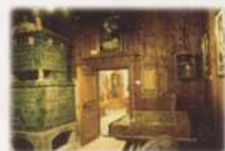
Viel Sehenswertes aus Kultur und Kunst

Sollte es einen Regentag geben, ist der Besuch von Schloß Ehrenburg (im Sommer täglich, außer am Sonntag Führungen), der gotischen Kirchen von St. Sigmund und Hofern und der Barockkirchen von Ehrenburg und Kiens empfehlenswert.