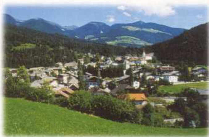
Blick auf die Pustertaler Gemeinde Kiens