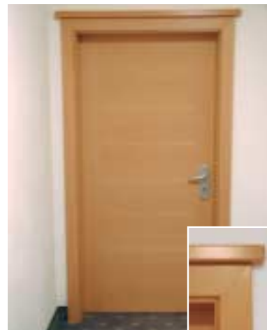
Hotel Central – Nova Levante Progettista: Ing. Seehauser