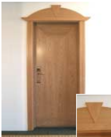
Hotel Premstallerhof – Frangarto