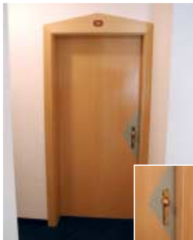
Pensione Brunner – Merano Progettista: Arch. Lee