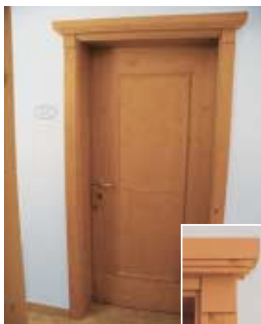
Pensione Croce Bianca – Lazfons Progettista: Arch. Tschaffert & Giovannini