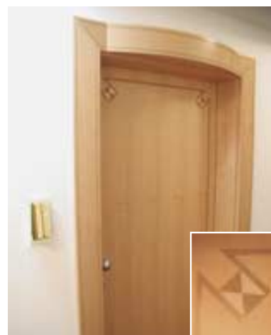
Hotel Ideal – Laives Progettista: Studio Pederiva