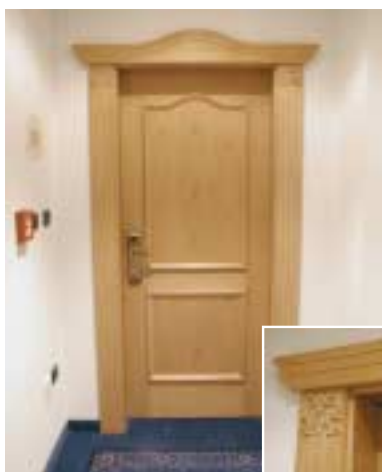
Hotel Mühlgarten – Santo Stefano Progettista: Arch. Adams Helmuth