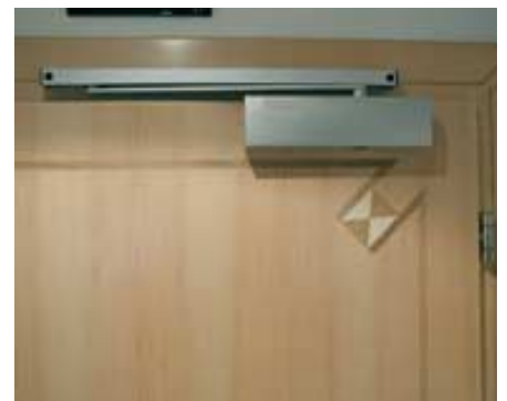
Le porte tagliafuoco Rubner sono omologate per ogni tipo di maniglia.