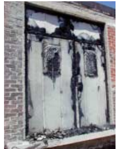
Un test di resistenza al fuoco presso il CSI di Milano – REI 60 con vetratura, parte laterale e sopra luce.