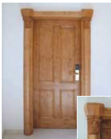
Hotel Falkensteinerhof – Valles Progettista: Waibl Planung