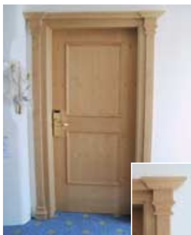
Hotel Reipertingerhof – Riscone Progettista: Arch. Lanzinger