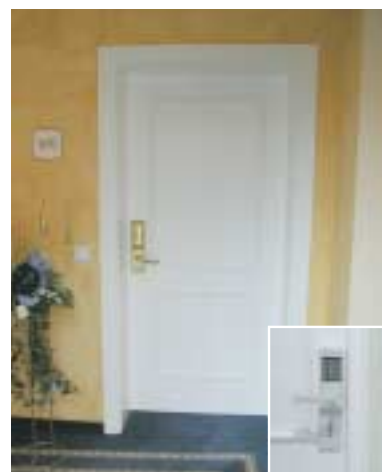
Parc Hotel – Caldaro Progettista: Arch. Wachter